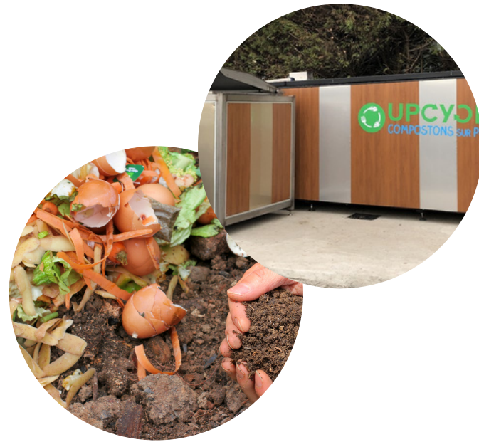
Compostaje para empresas HORECA y para Ciudades