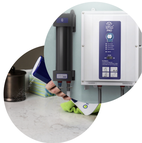
Limpieza con Ozono Estabilizado Acuoso