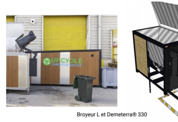
Broyeur L et Demeterra® 330

Cubos bio calados 4 € Y bolsa estanca kraft 10 litros 0.10 €