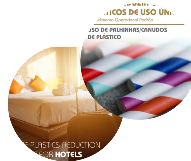
Reduccion en los Plásticos de Un Solo Uso