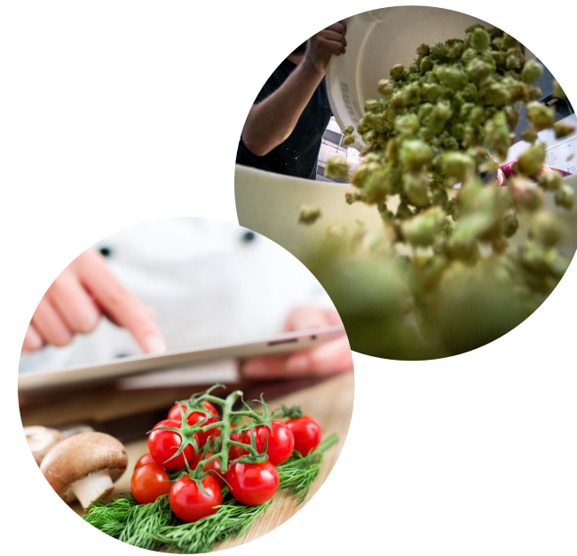
Reducción del Desperdicio de Alimentos para empresas HORECA