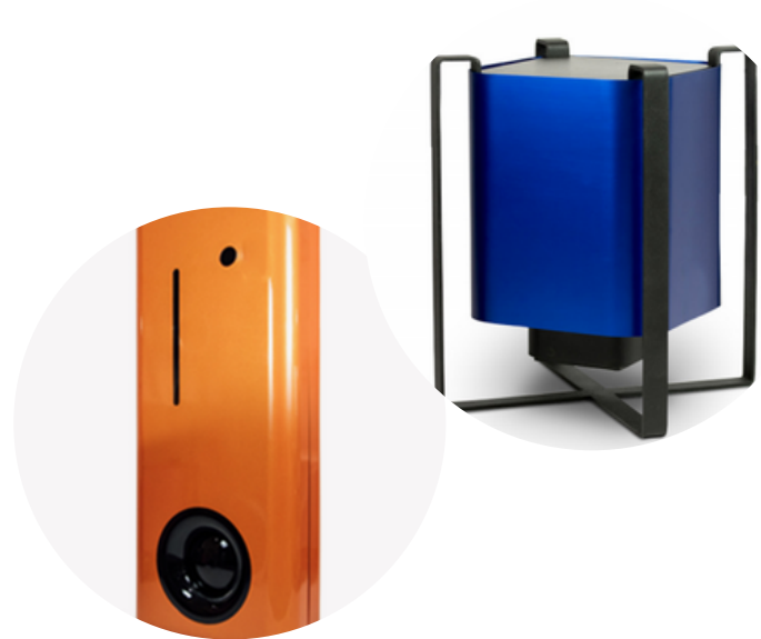
Saneamiento de Aire y Superficies en Áreas Públicas