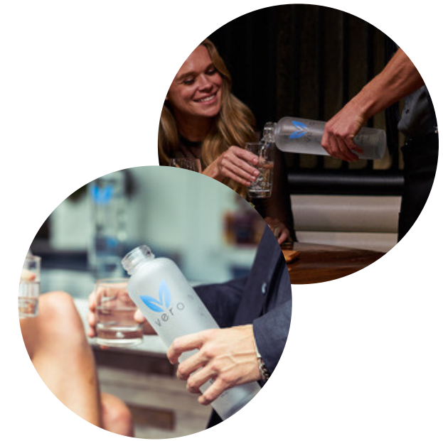
Agua Ultra Purificada, Pura y Sostenible